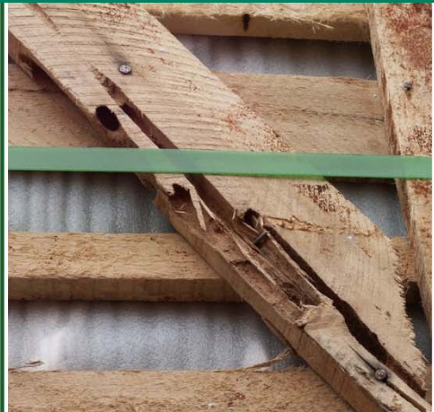
Fig. 2: Emballage med gallerier efter larver af asiatisk træbuk