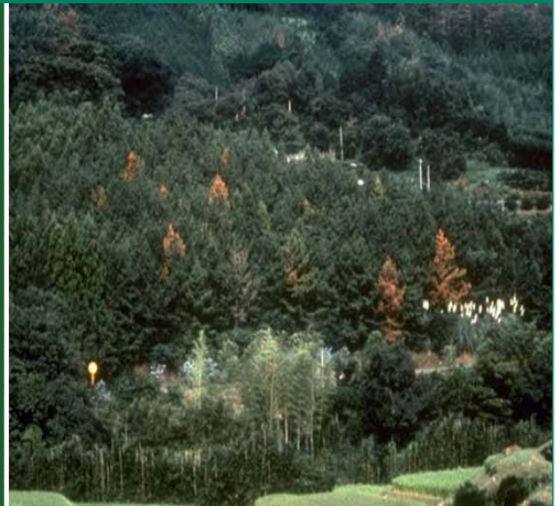
Fig. 3: Skov angrebet af fyrrevednematen. Den spredes ofte til nye områder med træemballage Kilde: EPPO og K. Venn Norge