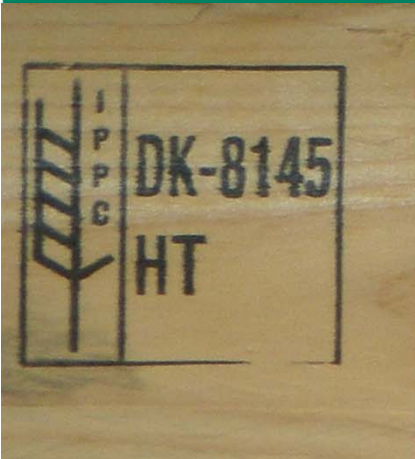
Fig. 1: Træemballage fra Danmark med -15 mærke