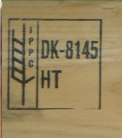
Fig. 1: Træemballage fra Danmark med ISPM 15 mærke