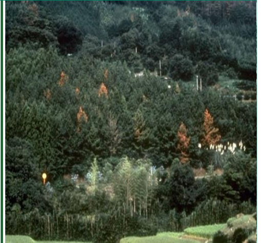
Fig. 3: Skov angrebet af fyrrevednematoden. Den spredes ofte til nye områder med træemballage