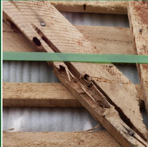
Fig. 2: Emballage med gallerier efter larver af asiatisk træbuk