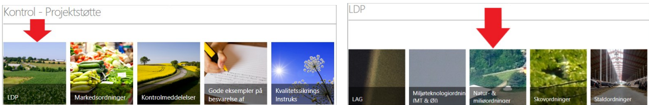
Figur 1: Her ligger instrukser og ordningsbilag på Kontrolportalen

Kontrolløren udfylder alle de blå felter i skemaerne, som er sat ind i rapporten under/efter afsyningen/kontrollen. Alle felter skal udfyldes.