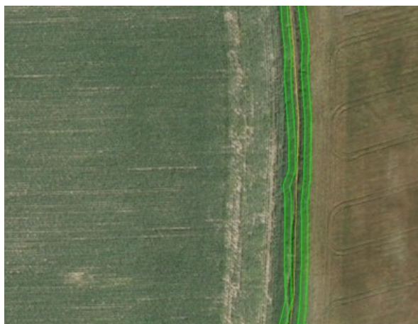
Figur 29. 2 meter bræmmelaget i IMK.

2 meter bræmmer vises også på kontrolgrundlaget i de tilfælde, hvor der er søgt støtte til bræmmearealerne fx hvis arealerne anvendes som MFO.