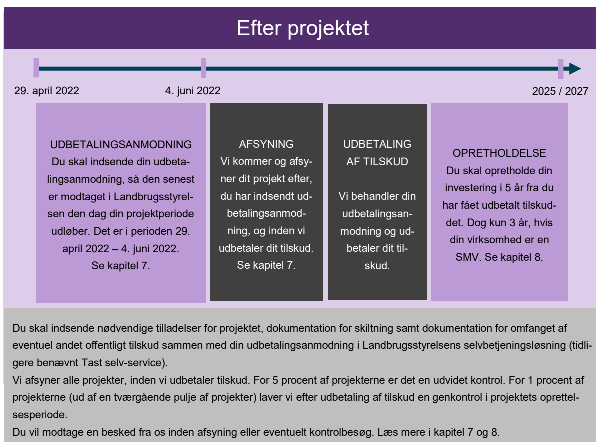
FIGUR 7.1. Tidslinje for fasen "efter projektet".

I figur 7.1. nedenfor kan du se en tidslinje for fasen efter projektet, som viser, hvad der skal ske, når du har afsluttet dit projekt.