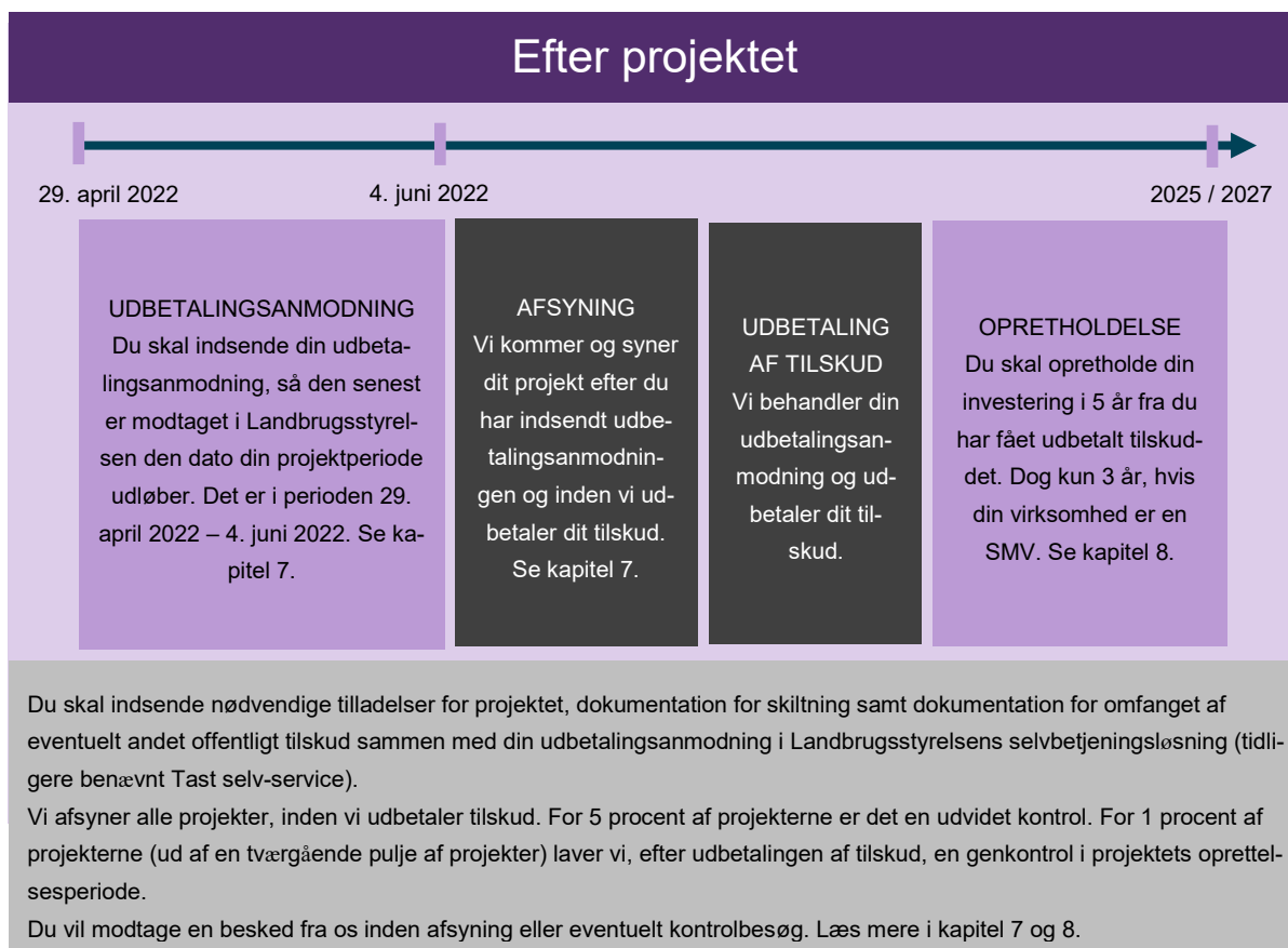
FIGUR 8.1. Tidslinje for fasen "efter projektet".

I figur 8.1. nedenfor kan du se en tidslinje for fasen efter projektet, som viser, hvad der skal ske, mens du skal opretholde projektet.