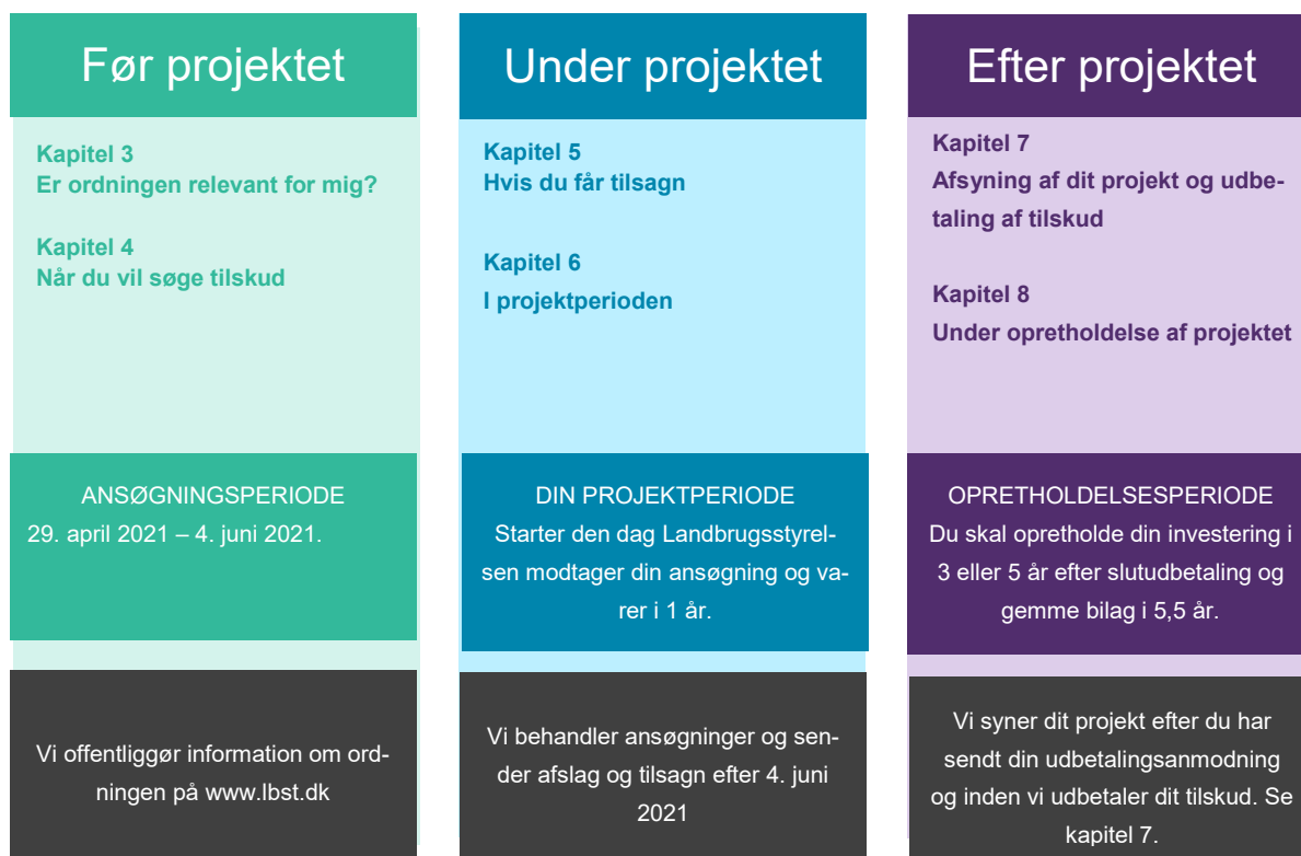
FIGUR 2.1. Overblik over vigtige datoer.