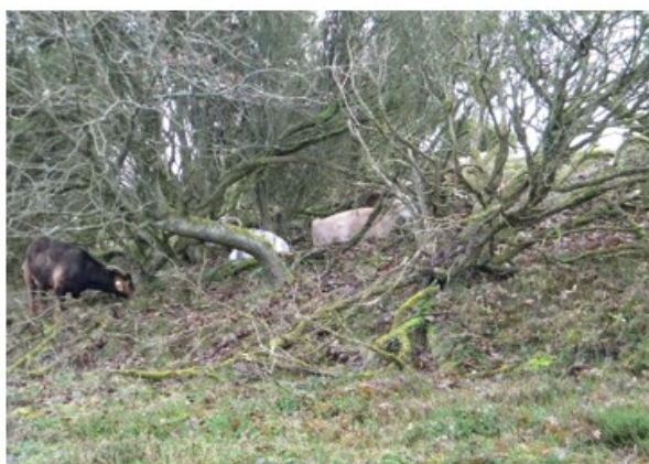
Nærbillede af græssende og hvilende geder i tæt buskads