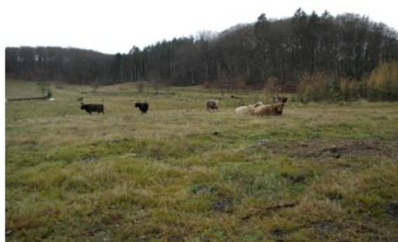
Totalbillede af græssende kvæg