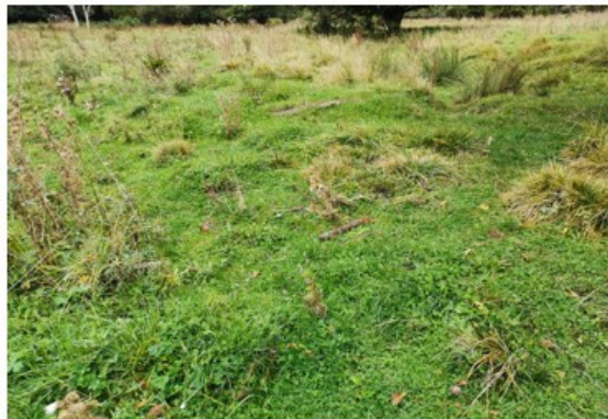
Totalbillede af varieret afbidningsmønstre – enkelte delområder afbidt og andre delområder viser urørte tuedannelser, der tilsammen angiver en aktivitet