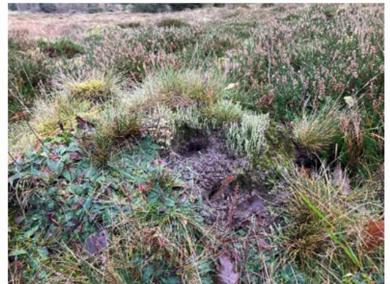
Nærbillede af nedbidt tue og klovspor