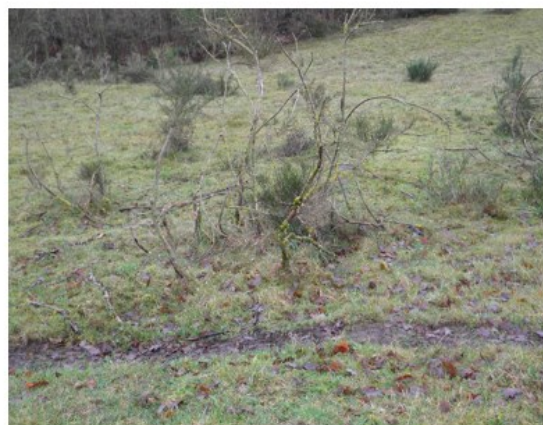
Terrænforskel med nedbidte buske, afgræsset baggrund og friske dyreveksler (bar jord)