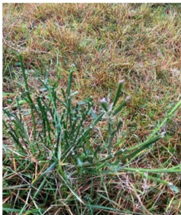
Nærbillede af nedbidt gyvel