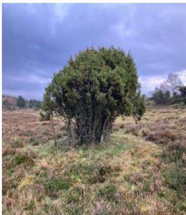
Totalbillede af busk og bundvegetation påvirket af græsningsdyr