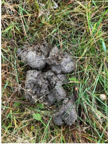
Nærbillede af Hestelort