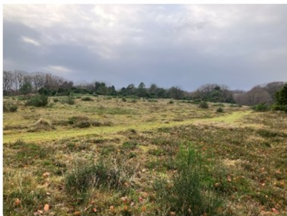
Afgræsset vegetation (græs) på hedeareal