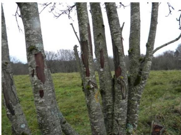
Totalbillede af barkskrab med afbidt græs bagved