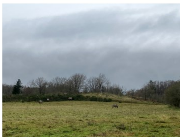
Totalbillede af græssende heste