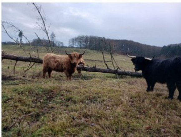
Nærbillede af græssende kvæg