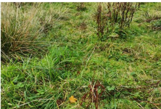
Variert (lavt/højt) plantedække som følge af afgræsning