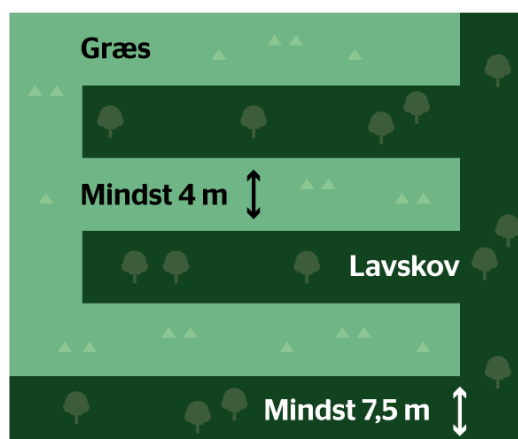
Figur 2: Hvordan en lavskovsmark og en græsmark kan flettes ind i hinanden:

Husk, at du også på græsmarken må have op til 100 spredte træer og buske pr. ha. Vær desuden opmærksom på, at en mark med lavskov ethvert sted skal have en bredde på minimum 7,5 meter, mens en græsmark ethvert sted skal have en bredde på minimum 4 meter.