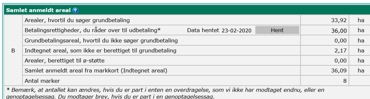
TABEL 2.2. Indhold af rubrik B