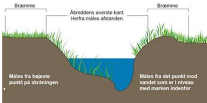
Figur 4.1. Illustrationen viser hvor en bræmme regnes fra alt efter overgangen fra tærren mod vandløb.

Bræmmen på 3 meter langs vandløb og søer beregnes fra vandløbets eller søens øverste kant. Den øverste kant er overgangen fra det skrånende terræn mod vandløbet eller søen til det flade terræn, der normalt kan jordbehandles. "Den øverste kant" af visse søer er overgangen mellem bevoksningen af vand- og sumpplanter og egentlig landplanter.