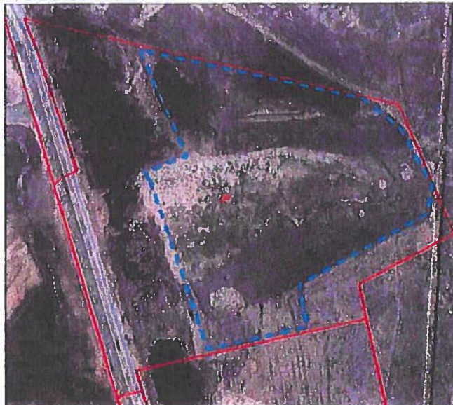
Fig. 2. Placering (omtrentlig) af nyt elhegn (blå stiplede linje). Rød linje er matrikelskel.

Arealet er i 2021 omlagt til økologisk drift.