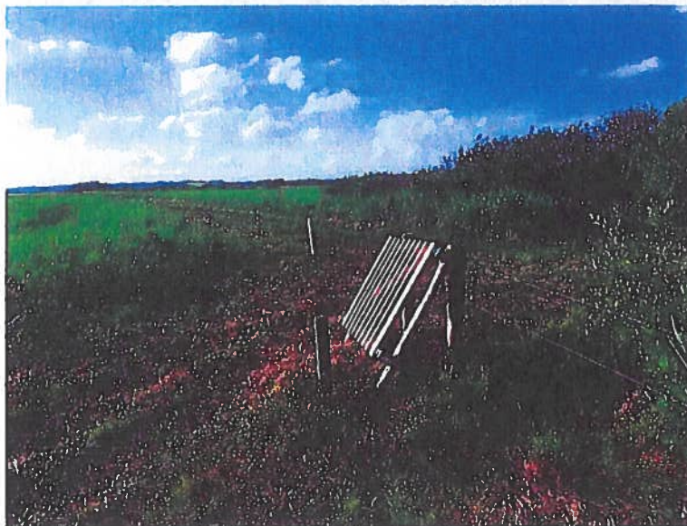
Fig. 5. Nyetableret klaplåge ved sti gennem arealet. Arealets nordøstlige hjørne anes ved rødt flag i baggrunden, på den anden side af stien.

Der fører en sti - fra P-plads ved [REDACTED] - over arealets nordøstlige del. Ved denne sti er der placeret en "klaplåge" der sikrer nem adgang til den hegnede del af arealet. Ved klaplågen vil der i løbet af vinteren 2021/22 blive opstillet en lille informationstavle med tekst som angivet i bilag 1.