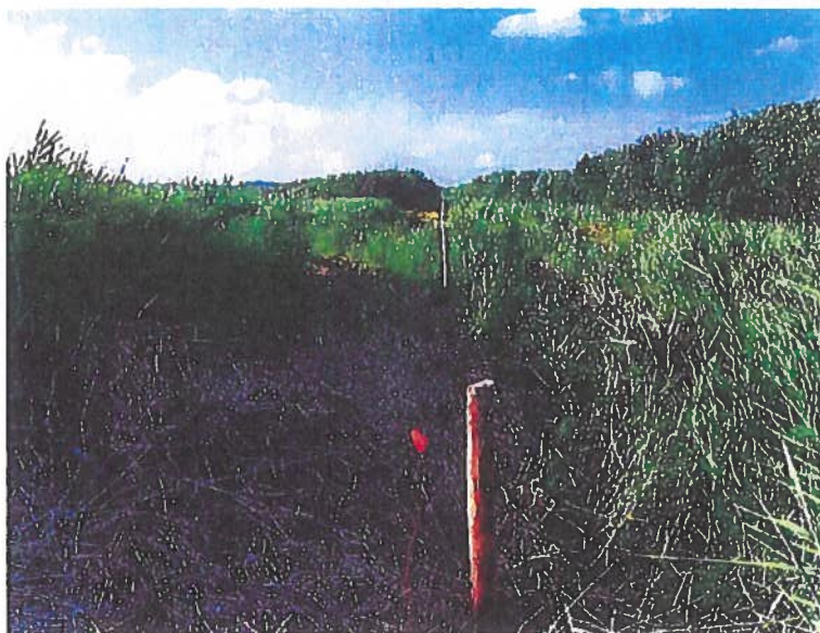
Fig. 3. Nyetableret to-trådet elhegn juli 2021, østlige skel ved (redacted).