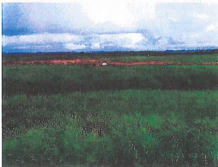
Fig. 4. Græssende kreaturer på arealet august 2021. Foto taget fra dæmningen i arealets vestside.

Græsningen kom af praktiske årsager relativt sent i gang i 2021 og derfor blev vegetationen ret høj forinden. Sidst på græsningssæsonen vil det derfor blive vurderet om nedgræsningen har været godt nok, eller om det er hensigtsmæssigt endnu engang at klippe vegetationen, med henblik på en lidt bedre start på afgræsningen i 2022.