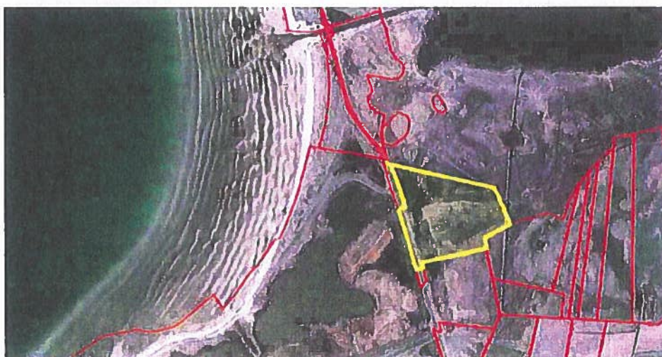
Fig. 1. Arealets placering (gul) mellem [REDACTED] og [REDACTED]

Det samlede areal der er omfattet af denne naturplejeplan er 10,7 ha. Heraf er en lille del offentlig vej, der forløber i arealets vestligste kant.