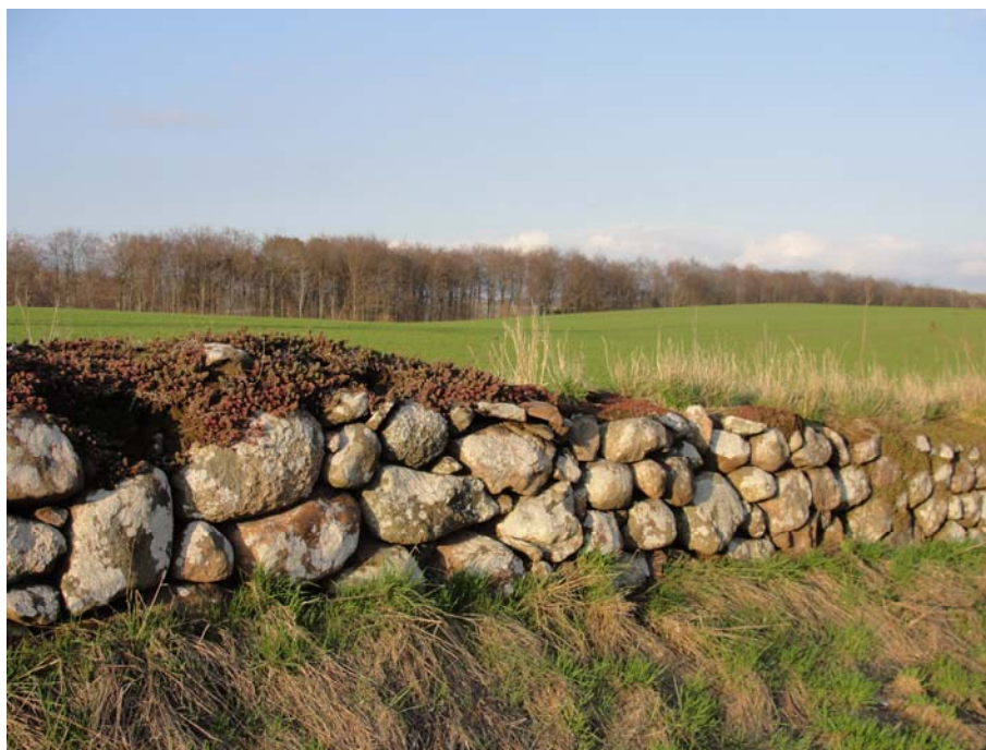
Figur 2.1 Stendige i herregårdslandskab ved Fåborg på Sydfyn. Foto: Nanna Strandberg april 2010.

et resultat af dette klarer pollinatorer, der er generalister sig også bedre end specialister i et menneskepåvirket landskab (Dupont & Overgaard Nielsen 2006). I en stor undersøgelse af betydningen af tab af habitater for vilde bier fandt Bommarco et al. (2010), at tab af habitat fører til ændret artssammensætning af bi-samfundet. Således reagerede sociale bier negativt uanset kropstørrelse, medens små generalister reagerede mere negativt på tab af habitater end små specialister. Modsat fandt Steffan-Dewenter et al. (2002), at solitære bier reagerer mere på tab af habitater end sociale bier navnlig på lokal skala, hvilket får dem til at pege på vigtigheden af at undersøge effekten på flere rumlige niveauer.