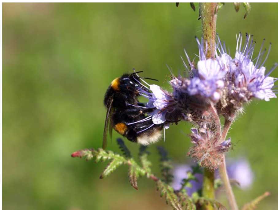
Figur 9.1 Mørk jordhumle ( Bombus terrestris ) på honningurt ( Phacelia tanacetifolia ).

Såning af striber af bi-planter og såkaldte vildtagre er et af de tiltag, der har været afprøvet primært med henblik på at give bedre forhold for det jagtbare vildt men i flere tilfælde også for at give mad (fx honningurt) til bestøvende insekter primært med tanke på honningbier (Figur 9.1). Vi har ikke fundet nogen undersøgelser af betydningen af disse områder for de bestøvende insekter men flere af de benyttede arter, som fx majs, er dog uden værdi for de vilde bestøvere.