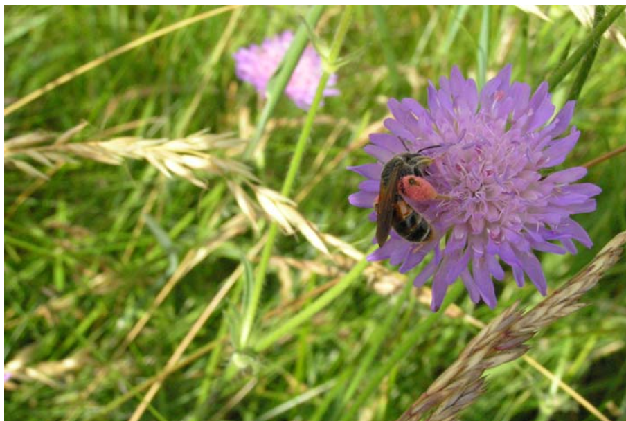
Figur 1.1 Blåhat-jordbien ( Andrena hattorfiana ) på blåhat ( Knautia arvensis ) ved Hverrestrup Bakker (Himmerland). Foto: Henning Bang Madsen, 14. juli 2005.

Oligolektiske bier har typisk en kort flyvesæson, som falder sammen med blomstringen af den eller de plantearter bierne besøger. Som eksempel på strengt oligolektiske bier kan nævnes blåhat-jordbien ( Andrena hattorfiana ) (Figur 1.1), der udelukkende fouragerer på blåhat ( Knautia arvensis ), og A. nasuta henter udelukkende pollen på læge-oksetunge ( Anchusa officinalis ).