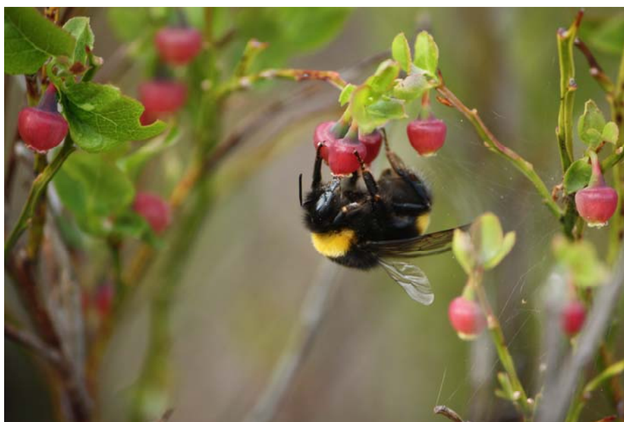
Figur 6.1 Lys jordhumle ( Bombus lucorum ) på blåbær ( Vaccinium myrtillus ).