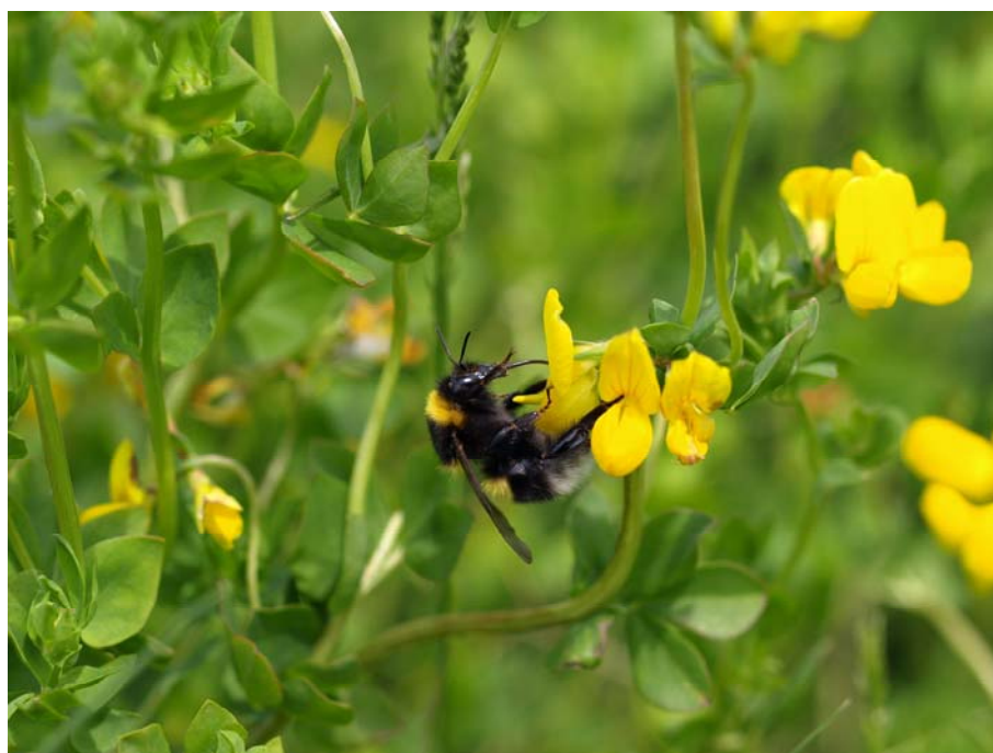
Figur 5.1 Havehumle ( Bombus hortorum ) på alm kællingetand ( Lotus corniculatus ).

Tungelængden er et af de træk, der adskiller de sjældne og truede humlebi-arter fra de almindeligt forekommende arter (se Tabel 5.1). Således er alle sjældne og truede arter langtungede. Dog forekommer humlebien med den længste tunge, havehumle ( B. hortorum ), almindeligt i Danmark, hvilket formentlig hænger sammen med denne arts tidligere fremkomst og korte kolonicyklus. Desuden er havehumle og agerhumle ( B. pascuorum ) ikke tilknyttet samme snævre udvalg af levesteder som de øvrige langtungede arter.