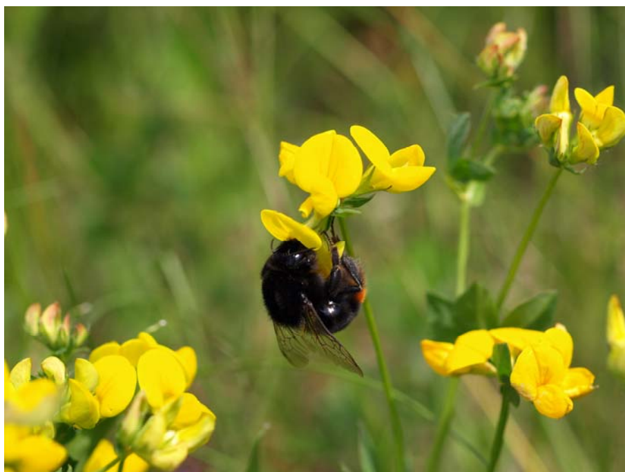
Figur 1.3 Stenhumle ( B. lapidarius ) på alm kællingetand ( Lotus corniculatus ).

Som dokumenteret i en mini-atlasundersøgelse af egentlige humlebier ( Bombus spp) i 10 kvadrater på 10 x 10 km i Jylland i perioden 1998-2001, er det dog fortsat muligt at finde 16 humlebiarter i Danmark. Kun 7 arter blev fundet i alle 10 kvadrater, og rødliste-arterne kløverhumle, foranderlig humle, græshumle og enghumle forekom kun i et kvadrat, klokkehumble i 2 kvadrater og de resterende 4 arter i 5-8 kvadrater. De sjældne og rødlistede arter blev typisk fundet i habitater som overdrev, heder, høslætmarker og strandenge (Schmidt 2003). Se i øvrigt Tabel 5.1, p. 28 vedr. de enkelte arters foretrukne habitater.