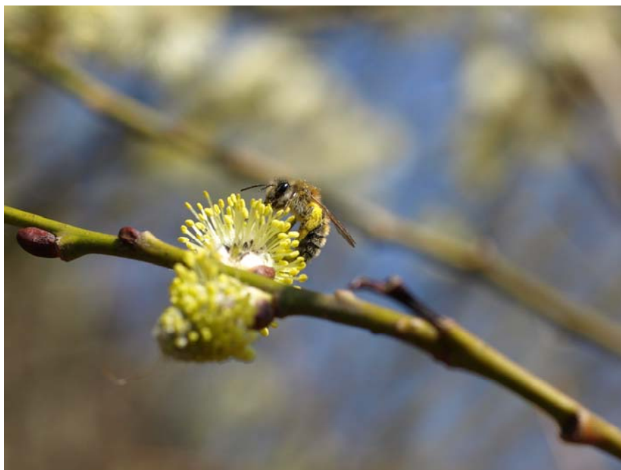
Figur 1.2 Forårs-jordbien ( Andrena praecox ) på selje-pil ( Salix caprea ) ved Vestvolden (Brøndby). Foto: Henning Bang Madsen, 11. april 2009.

Humblebier er ikke strengt specialiserede, men nogle arter som kløverhumle ( B. distinguendus ), felthumle ( B. ruderatus ), klokkehumle ( B. soroeensis ), jordboende humle ( B. subterraneus ) og græshumle ( B. ruderarius ) besøger typisk et begrænset antal arter. Disse tilhører typisk ærteblomst- (Fabaceae), læbeblomst- (Laminaceae), kartebolle- (Dipsacaceae), rosen- (Rosaceae), rublad- (Boraginaceae) og kurveblomstfamilien (Asteraceae). Fødepræferencerne for de enkelte humlebiarter fremgår af App. 1. Som det fremgår af dette, udnytter almindelige humlebi-arter, som fx lys og mørk jordhumle, stenhumle, havehumle, agerhumle, og hushumle, generelt mange forskellige vilde plantearter, tilhørende mange forskellige plantefamilier, og de udnytter desuden også mange forskellige haveplanter og flere blomstrende afgrøder (Benton 2006, Goulson et al. 2002, 2005). De sjældne og udryddelsestruede arter, som fx kløverhumle, felthumle, græshumle, moshumle og hedehumle, udnytter derimod et begrænset antal arter tilhørende få familier (Goulson 2010). Man skal dog være opmærksom på, at almindelige og hyppigt forekommende arter også hyppigere vil blive iagttaget, hvorimod fødevalget for de mindre almindelige arter godt kan være mere varieret end antaget på baggrund af de meget få observationer, der findes.