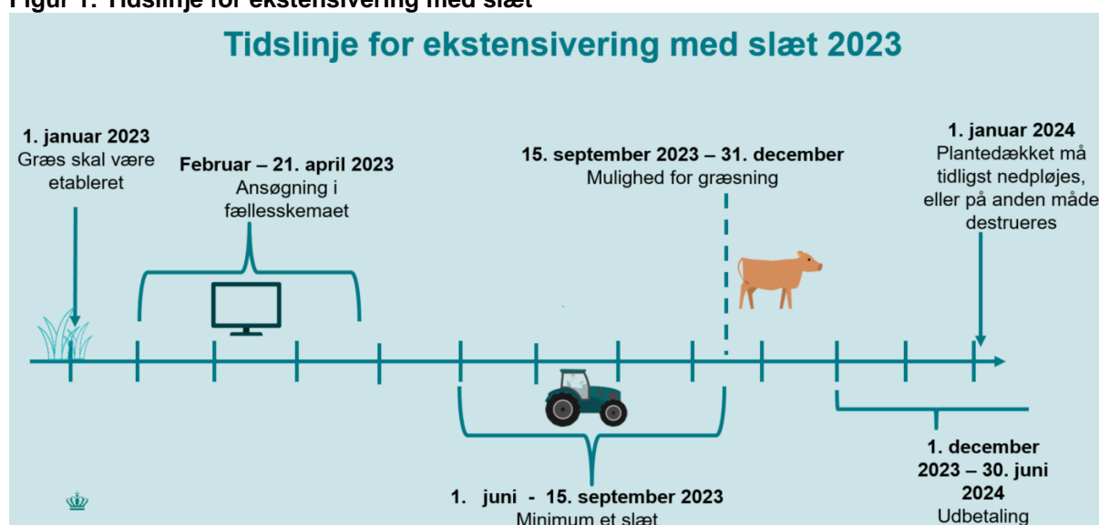
Figur 1: Tidslinje for ekstensivering med slæt

Du kan søge tilskud til ekstensivering med slæt i fællesskemaet fra februar 2023. Vi forventer at udbetale tilskuddet samtidig med, at vi udbetaler grundbetalingen. På figur 1 kan du se en tidslinje med de vigtigste frister.